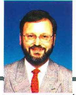
Jean-Pierre FOURRÉ 47 ans, ingénieur en informatique Député de Seine-et-Marne Conseiller régional Président de l'E.P.A. de Marne-la-Vallée Conseiller municipal de Bussy-Saint-Georges. Marié, 2 enfants.